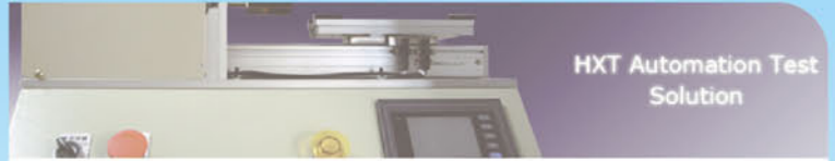
HXT Automation Test Solution