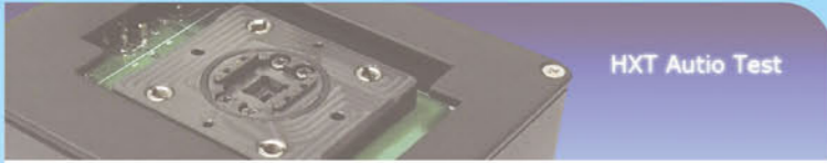
HXT Auto Test